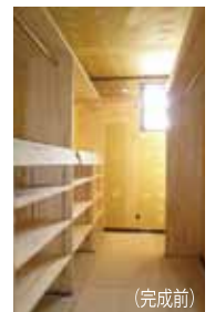
ウォークインクローゼット