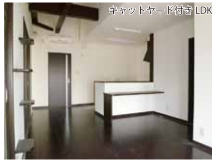
キヤットヤード付き LDK~吹き抜け