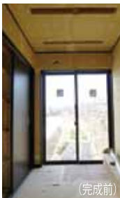
ユーティリティスペース