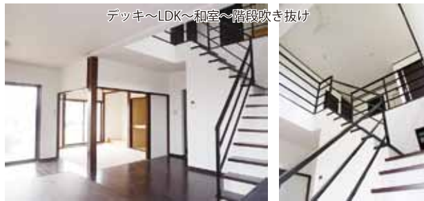
デッキ~LDK~和室~階段吹き抜け

階段吹き抜けとデッキから自然の光と風を取り入れる事が出来る LDK は、小上がりのダイニングスペースと、引き込み建具を開くと一体となる和室が、大空間を演出します。